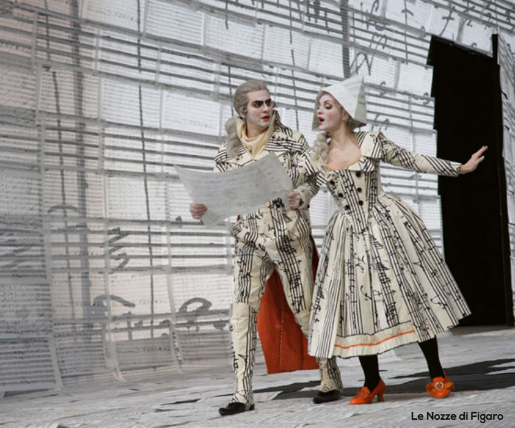
Le Nozze di Figaro