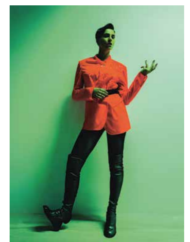
Salome : Die Salome unserer Zeit – Asmik Grigorian zurück in Hamburg