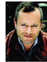
Dmitri Tcherniakov Inszenierung und Bühne

Unterstützt durch die Stiftung zur Förderung der Hamburgischen Staatsoper