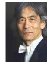
Kent Nagano Musikalische Leitung

Der vielfach prämierte Regisseur realisiert weltweit Opern, u. a. in St. Petersburg, Moskau, London, Brüssel, Amsterdam oder Düsseldorf. 2013 eröffnete seine Neuinszenierung La Traviata die Spielzeit der Mailänder Scala. Es folgte sein Debüt an der Metropolitan Opera New York mit Fürst Igor . An der Berliner Staatsoper inszenierte er zuletzt Wagners Ring , bei der Ruhrtriennale Aus einem Totenhaus , in München Der Freischütz und Lulu , in Zürich Pelléas et Mélisande und Jenůfa .