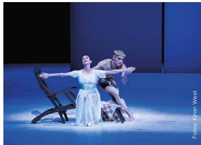
Alessandra Ferri als Romola Nijinska und Karen Azatyan in Nijinsky (o.); Edvin Revazov und Alexandr Trusch (r.)

Da keine Filmaufzeichnungen von Vaslaw Nijinsky beim Tanzen existieren, spürt John Neumeier der Suggestionskraft, die von ihm ausging, in den Kunstwerken der Zeitgenossen nach – etwa in Zeichnungen von Jean Cocteau und Gustav Klimt. Aus der Erkenntnis, damit einen gleichsam authentischen Zugang gefunden zu haben, entwickelte John Neumeier die besondere künstlerische „Haltung“ für die Kreation seines Balletts Nijinsky . Das Hauptziel war weniger eine Rekonstruktion historischer Tanzschritte, sondern ein Nachempfinden der spektakulären Wirkung, die von