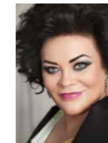
Violeta Urmana Herodias

an der Bayerischen Staatsoper für Der Zwerg zusammen. Wichtige Partien seiner internationalen Opernkarriere sind außerdem Števa ( Jenůfa ) und Grishka Kuter'na ( Die Legende der unsichtbaren Stadt Kitez ) sowie Grigorij/Dimitrij ( Boris Godunow ). Er trat u. a. am Opernhaus Zürich, am Bolschoi-Theater in Moskau, an der Niederlandse Opera, an der Komischen Oper in Berlin, beim Maggio Musicale Fiorentino und beim Festival d'Aix-en-Provence und bei den Salzburger Festspielen auf.