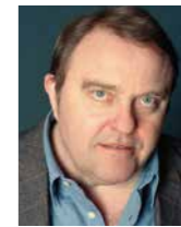
Gustav Peter Wöhler Händel