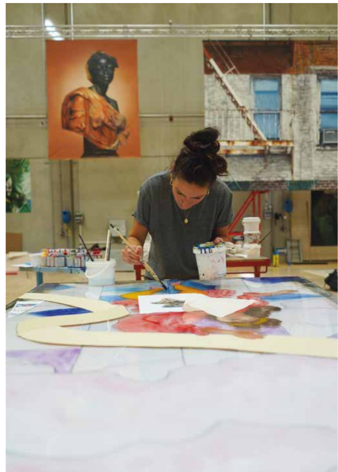
Impressionen aus den Werkstätten, wo das Bühnenbild mit Barockmotiven entsteht. Eine Badewanne? Lassen Sie sich überraschen!

Freuen Sie sich auf einen ungewöhnlichen Abend in der opera stabile, der die Musik Händels ganz neu zum Leben erweckt, ein Abend, der vielleicht eine Operette, eine queere Lovestory, ein Künstlerdrama, eine ganz große Oper sein könnte, oder auch alles gleichzeitig – entscheiden Sie selbst!