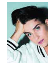
Asmik Grigorian Salome

als eine der führenden Opernsängerinnen im italienischen und deutschen dramatischen Fach, von 2001 bis 2002 wechselte sie ins dramatische Sopranfach. Zu ihrem Repertoire zählt sie u. a. die Wagner-Partien Kundry, Fricka, Sieglinde, Brangäne, Waltraute und Isolda, die Verdi-Partien Amneris, Azucena und Eboli sowie Zia Principessa ( Suor Angelica ) oder Jokaste ( Oedipus Rex ), die sie weltweit an vielen wichtigen Opernhäusern wie beispielsweise der Metropolitan Opera oder der Arena di Verona darstellt.