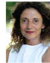
Adriana Altaras Inszenierung

gibt als Regisseurin von Händel's Factory ihr Debüt an der Staatsoper Hamburg. Sie wurde in Zagreb geboren und wuchs in Italien und Deutschland auf. Mehrfach wurde sie als Schauspielerin ausgezeichnet, erhielt u. a. den Silbernen Bären (2000) und den Bundesfilmpreis (1988). Als Hausregisseurin war sie am Berliner Maxim-Gorki-Theater (2002–2004) und am Potsdamer Hans-Otto-Theater (2006–2008) tätig, als Opernregisseurin arbeitete Sie u. a. an der Neuköllner Oper in Berlin, an der Berliner Staatsoper, den Staatstheatern Kassel, Braunschweig und Meiningen, an den Theatern Augsburg, Aachen, Osnabrück, Graz und Bern. Außerdem ist sie Autorin der Bücher Titos Brille (Spiegel-Bestseller), Doitscha , Das Meer und ich waren im besten Alter , Die jüdische Souffleuse und Besser allein als in schlechter Gesellschaft .