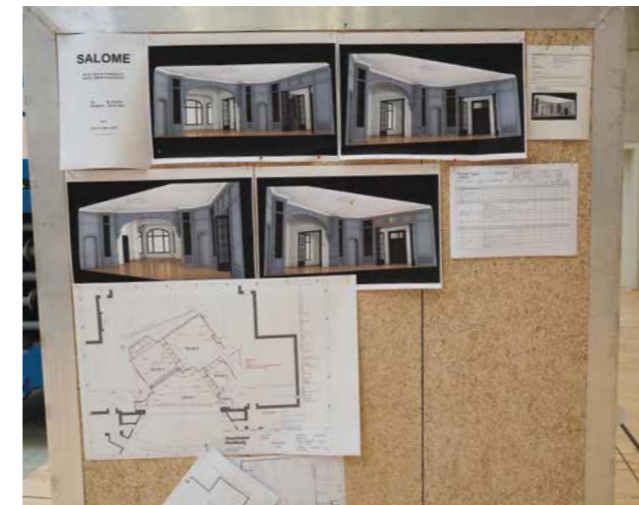
Nach genauen Plänen entsteht das Bühnenbild in den Werkstätten.